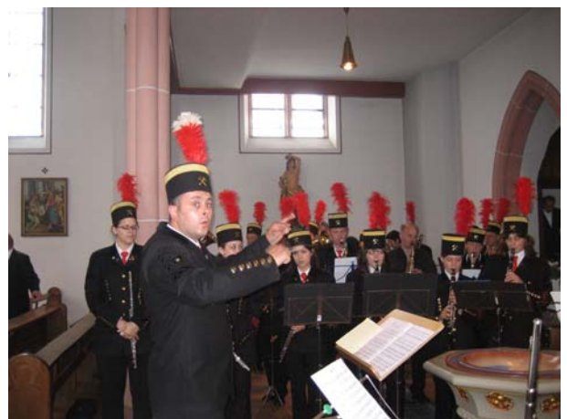
The Glory of Love nach der Trauung