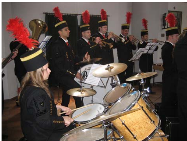
Praise the Lord – Lobe den Herrn