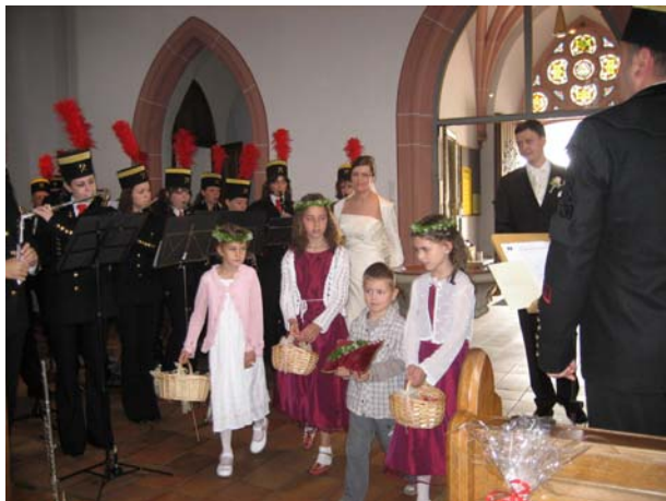
Highland Cathedral zum Einzug