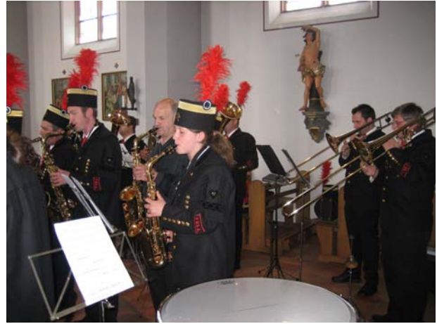
Grandioser Abschluss mit Musik von John Miles