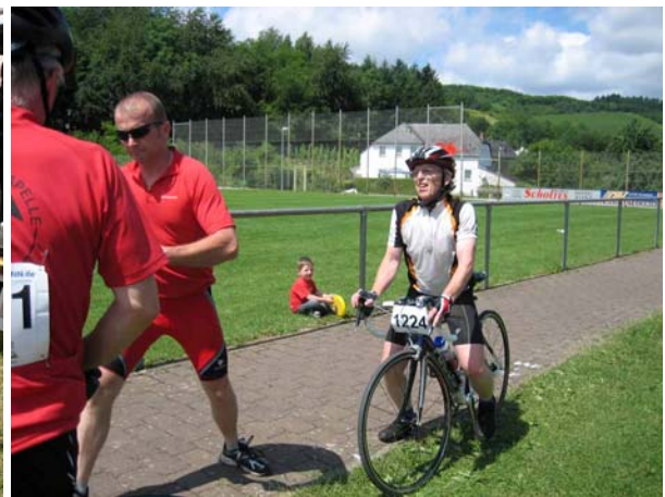
... bevor es in die nächste Runde geht.