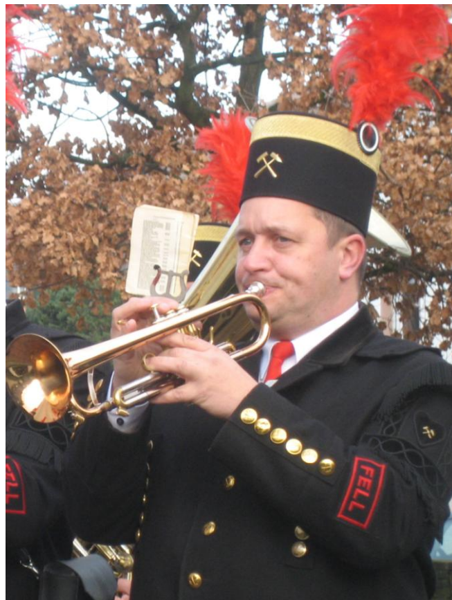
Beerdigung und Trauergottesdienst am 10. März 2010 in der evangelischen Kirche, Thalfang